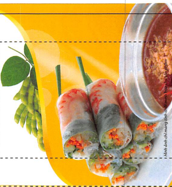
Hình ảnh chỉ mang tính chất minh họa cho sản phẩm